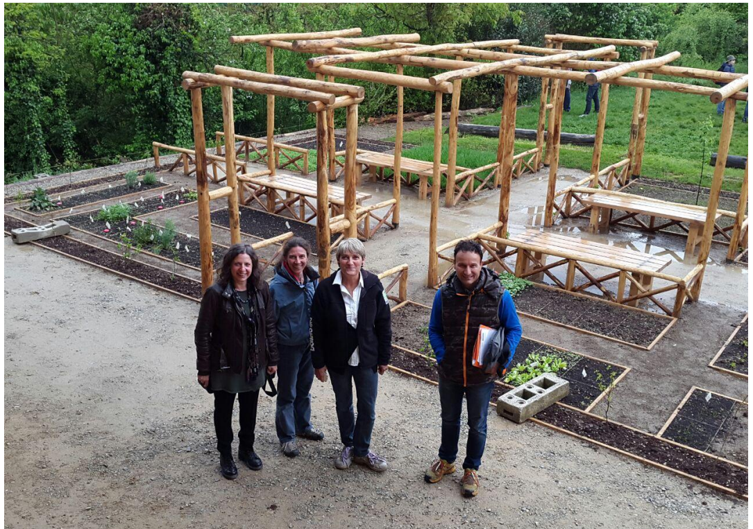
Fig. 7 Giorno di chiusura dei lavori per la realizzazione dell'Orto Romano di Augusta Bagiennorum , 27 Aprile 2015, Bene Vagienna.