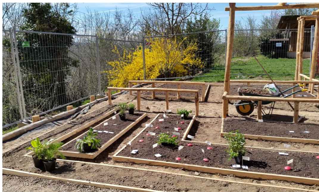
Fig. 4 Cantiere dell'Orto Romano, Aprile 2015, Bene Vagienna.