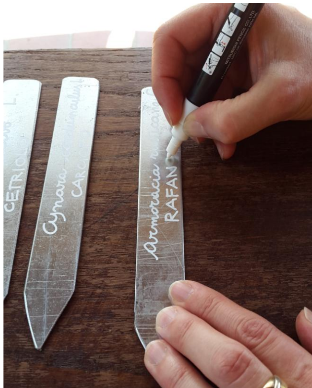
Fig. 9 Segnapiante in acciaio zincato, Orto Romano di Augusta Bagiennorum, Giugno 2015, Bene Vagienna.