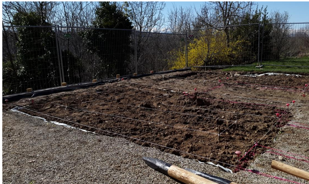
Fig. 3 Cantiere dell'Orto Romano, Marzo 2015, Bene Vagienna.