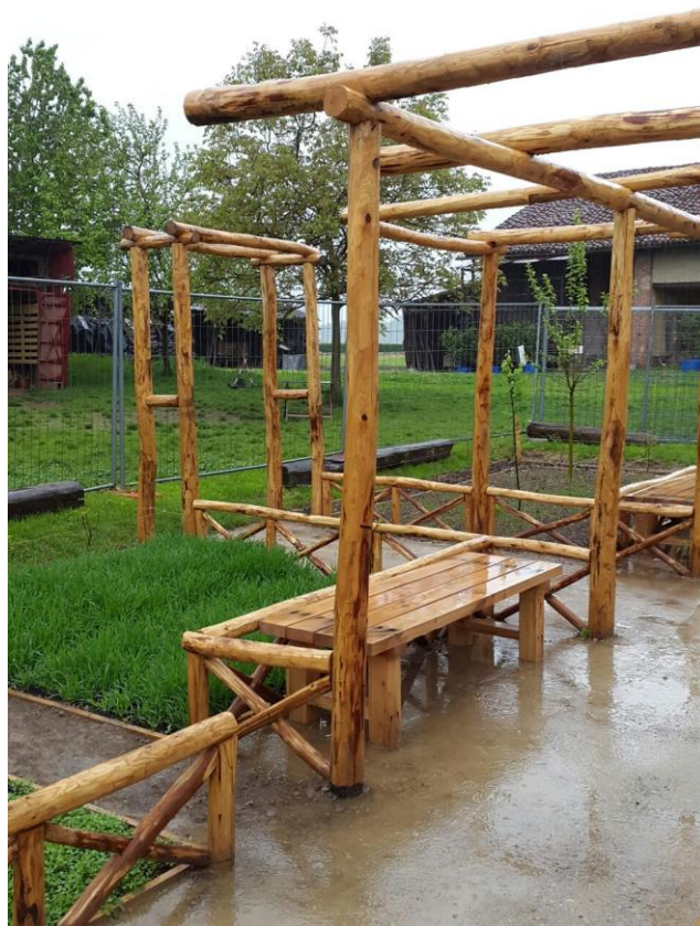
Fig. 6 Cantiere dell'Orto Romano, Aprile 2015, Bene Vagienna.