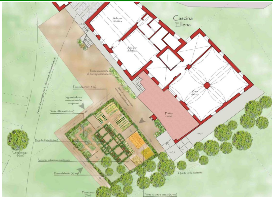
Tavola di progetto preliminare