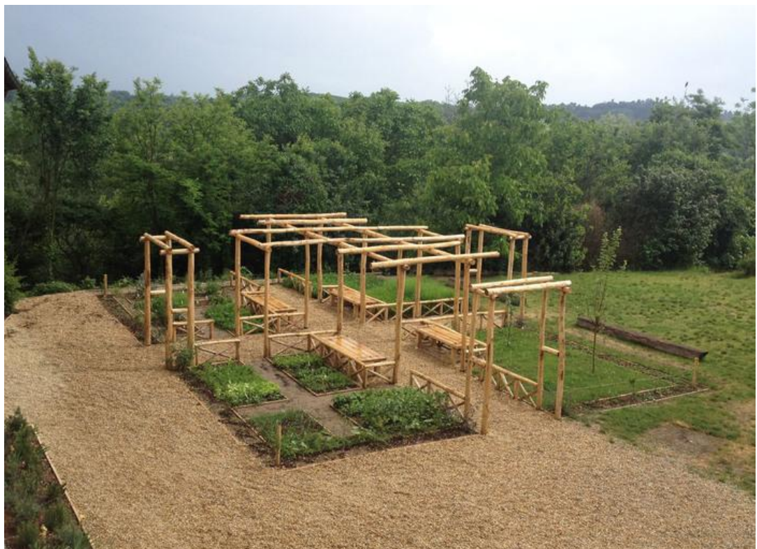
Fig. 8 Orto Romano di Augusta Bagiennorum , Maggio 2015, Bene Vagienna (Fotografia di Marco Salzotto).