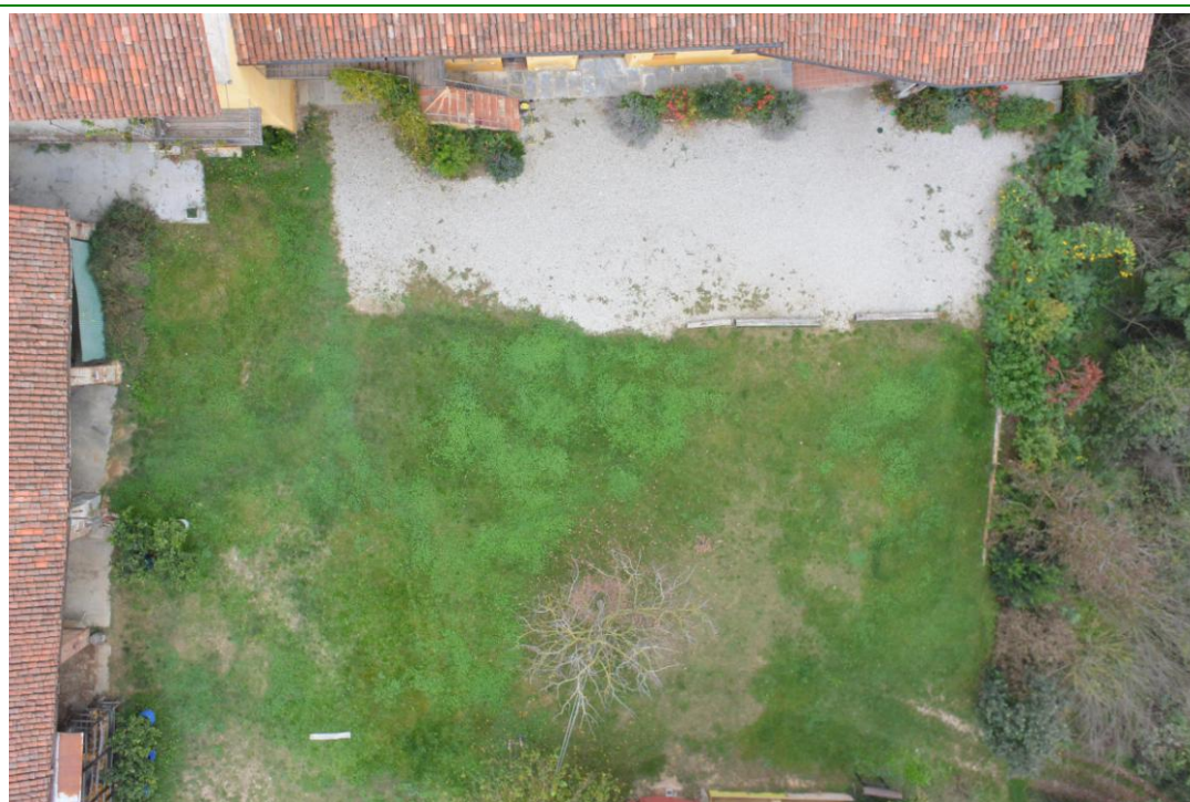
Fig. 1 Ripresa aerea con drone dell'area di intervento, Ottobre 2014, Bene Vagienna.