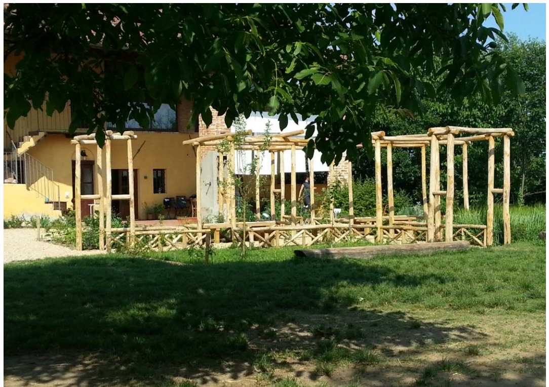
Fig. 12 Giardino domestico della casa romana di Augusta Bagiennorum , Giugno 2015, Bene Vagienna.