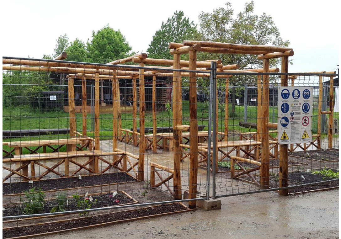
Fig. 5 Cantiere dell'Orto Romano, Aprile 2015, Bene Vagienna (Fotografia di Paolo Roagna).