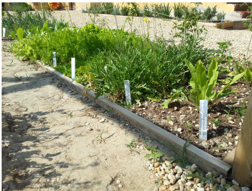
Fig. 10 Settore delle piante orticole dell'Orto Romano di Augusta Bagiennorum, Giugno 2015, Bene Vagienna.