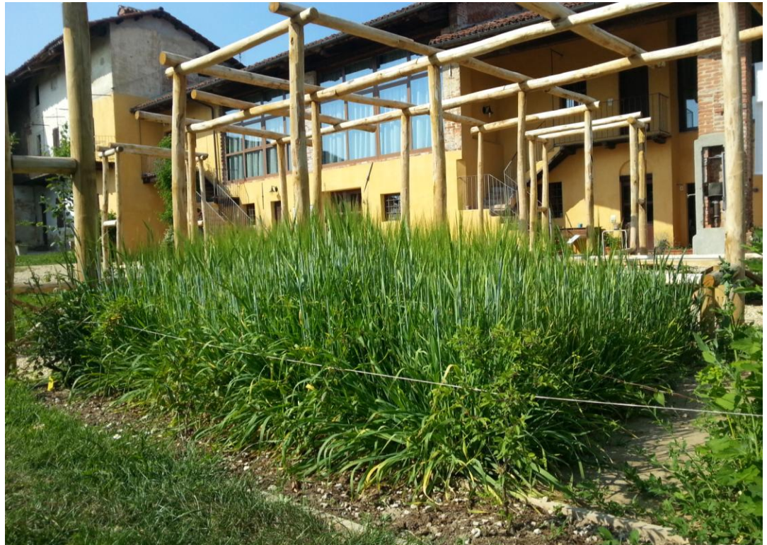
Fig. 11 Settore delle piante cerealicole dell'Orto Romano di Augusta Bagiennorum , Giugno 2015, Bene Vagienna.