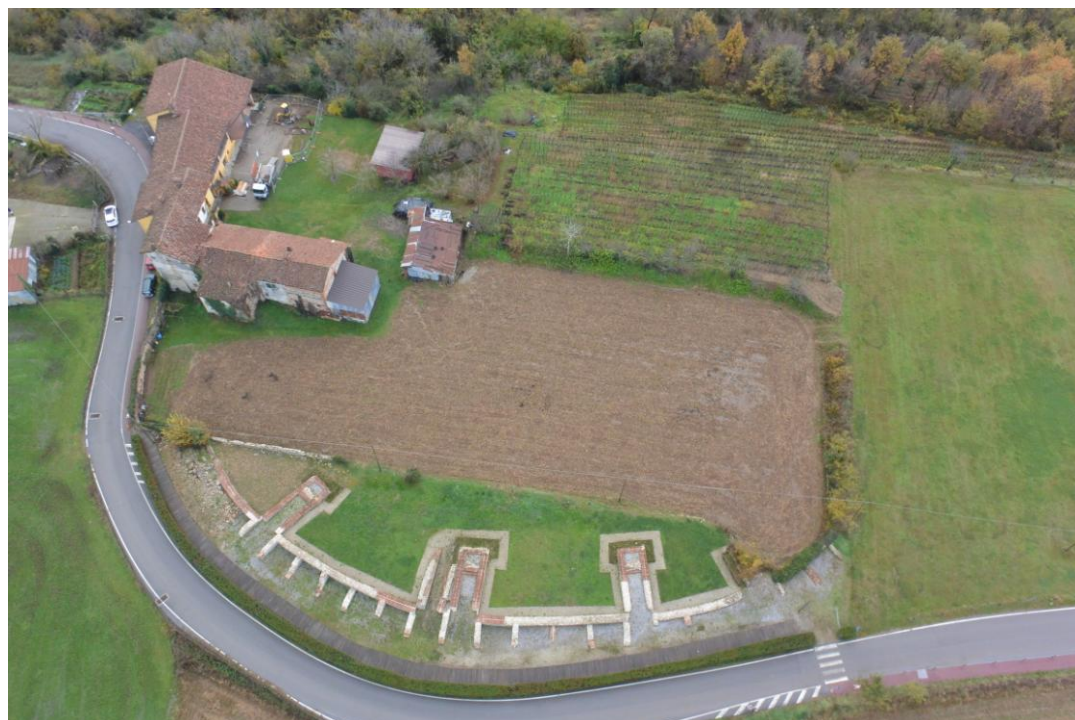
Fig. 2 Ripresa aerea con drone, Novembre 2014, Bene Vagienna.